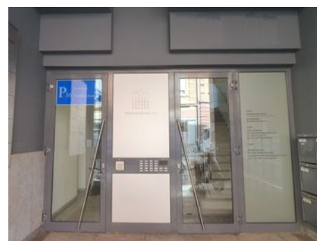
Zugang (Fußgänger): Brückenkopfstraße